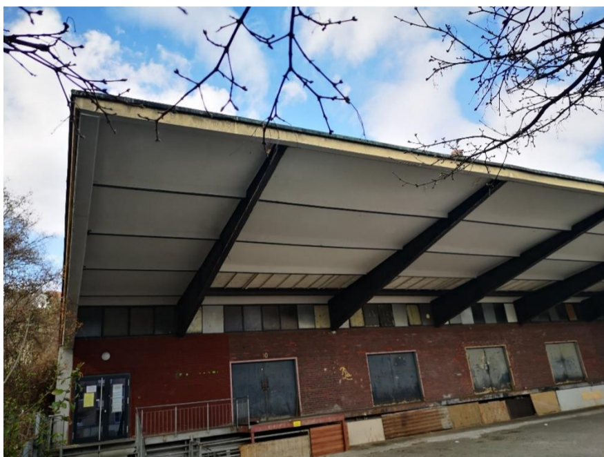
Foto: Moschee im Coop-Viertel

Wissen Sie, warum dieses Viertel den Namen „Coop“ hat? Sie kennen bestimmt die Moschee hier im Stadtteil (sh. Bild links). In diesem Gebäude war früher mal ein Coop – eine Supermarktkette. Deswegen heißt die Nachbarschaft hier Coop-Viertel. Dieses Viertel liegt zwischen Bahntrasse und Heilbronner Straße.