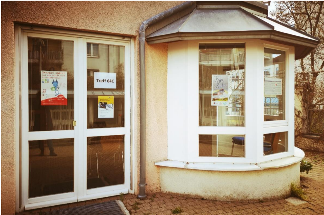
Foto: Der Treff 64C von außen. Hier finden viele verschiedene Angebote für die Menschen aus dem Stadtteil statt.