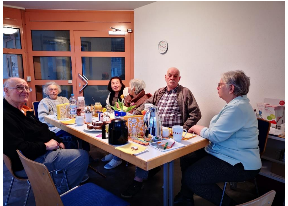
Foto: gemütliches Beisammensitzen im Treff 64C bei Kaffee und Kuchen